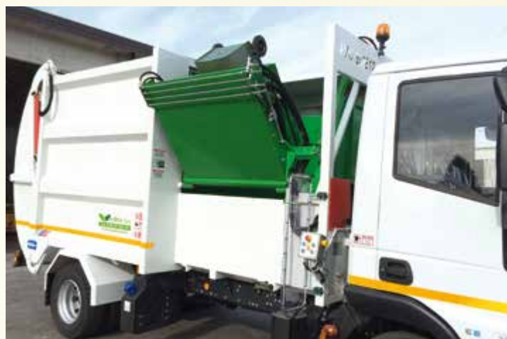
Operatore in massima sicurezza.