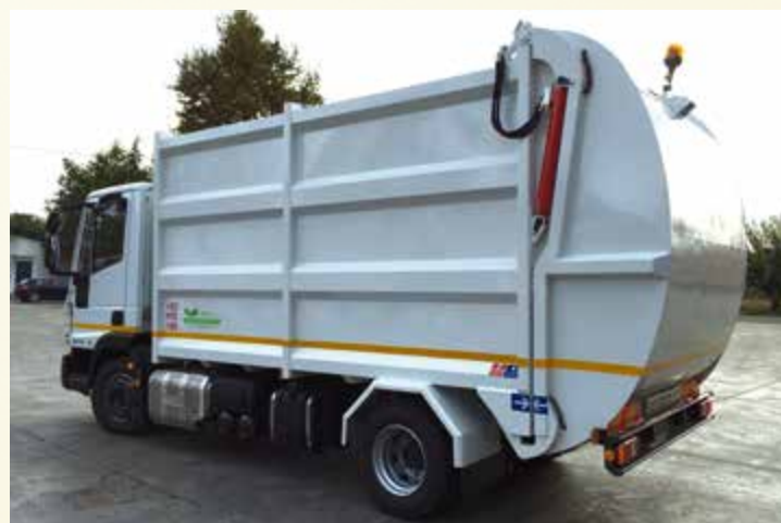
Notevole riduzione dei tempi di raccolta.

grafica - stampa - masterprint... - www.masterprint.it