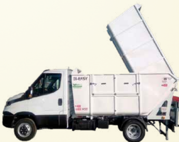
Easy: semplice e compatto.

grafica - stampa - masterprint... - www.masterprint.it