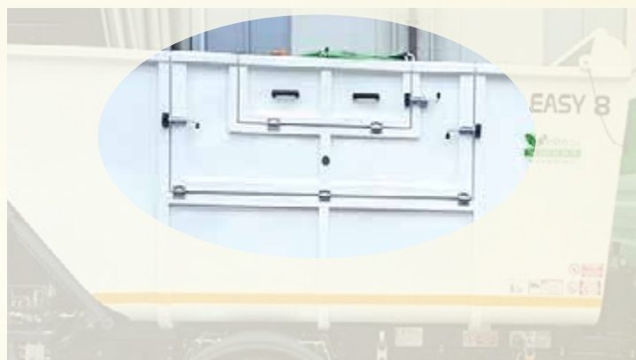
PARTICOLARE: doppia portella, su richiesta.