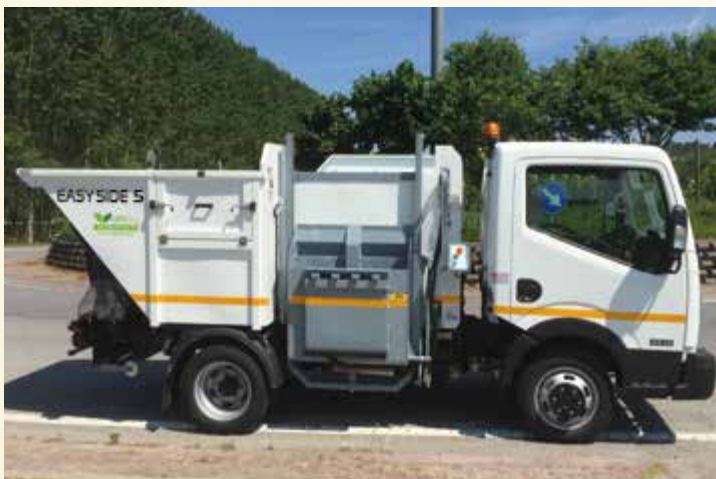
Unico nel suo genere.