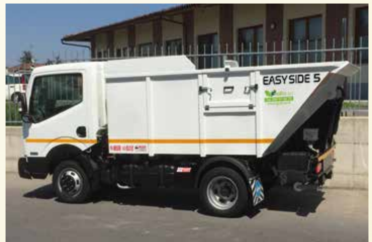
Notevole riduzione dei tempi di raccolta.

grafica - stampa - masterprint... - www.masterprint.it