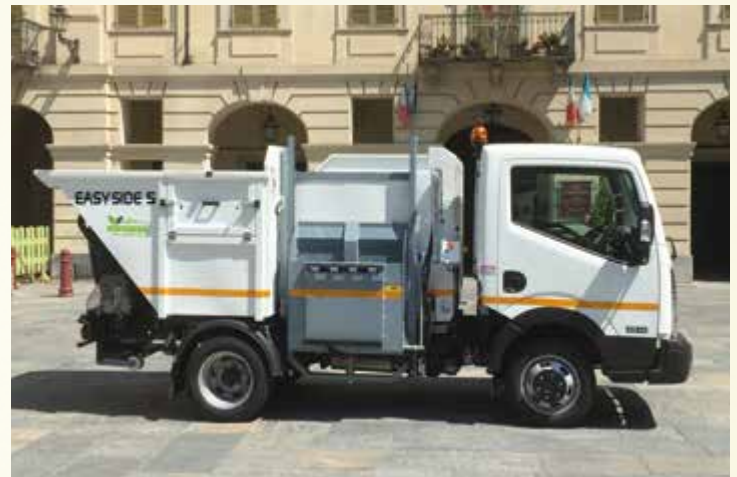
EASY SIDE: PRECEDENZA ALLA SICUREZZA Esclusivamente su telaio con guida a destra.